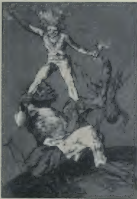
Subir y bajar.

immédiat de retour. C'est sur ces entrefaites qu'arriva à Madrid le nouvel ambassadeur français, M. d'Urtubize. Le 1 er octobre, il remettait à Florida Blanca la lettre l'accréditant comme chargé d'affaires et une lettre autographe de Louis XVI à Charles IV. L'accueil de Florida Blanca fut plus que froid. « Faites attention à ce que je vais vous dire, et conduisez-vous en conséquence,